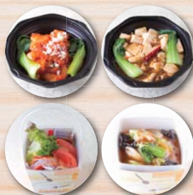
※テイクアウト容器例