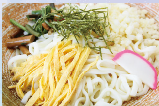
ぶっかけうどん・そば ¥900