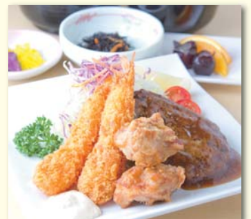
はすの実定食 ..... ¥770