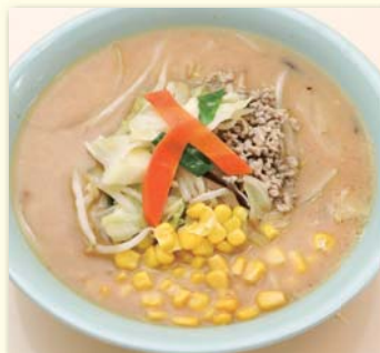
味噌ラーメン ..... ¥560