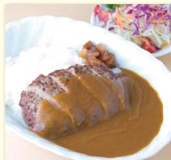
ハンバーグカレー(サラダ付) ..... ¥650