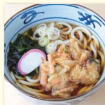
かき揚げそば/うどん .....¥540