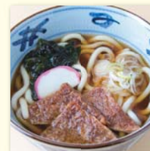
きつねそば/うどん .....¥480