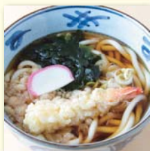
天ぷらそば/うどん .....¥560