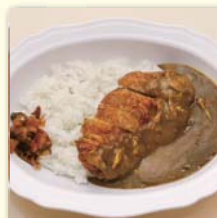
カツカレー(サラダ付) .....¥670