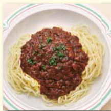
ミートソーススパ(サラダ付) .....¥560