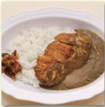
カツカレー(サラダ付) .....¥670