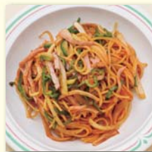
ナポリタン(サラダ付) .....¥520