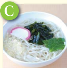
C ミニ稲庭うどん .....¥350