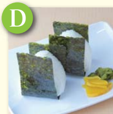
D おにぎり・梅/鮭 .....¥260