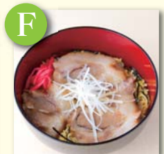
F ミニチャーシュー丼 .....¥320