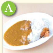
A ミニカレー .....¥270