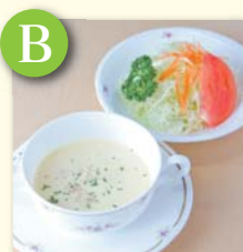
B スープ&ミニサラダ .....¥270